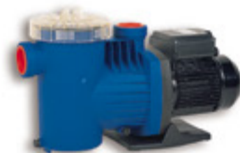
Filtros e bombas