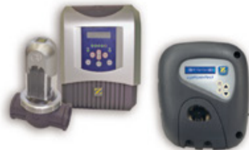
Tratamento da água