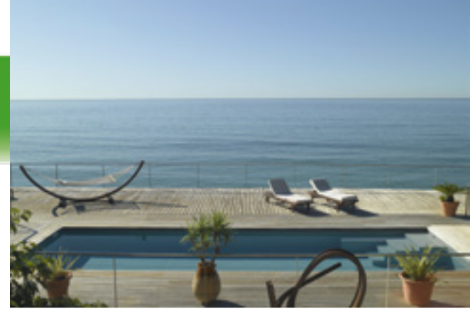
Realização: AQUA DIFFUSION PISCINES