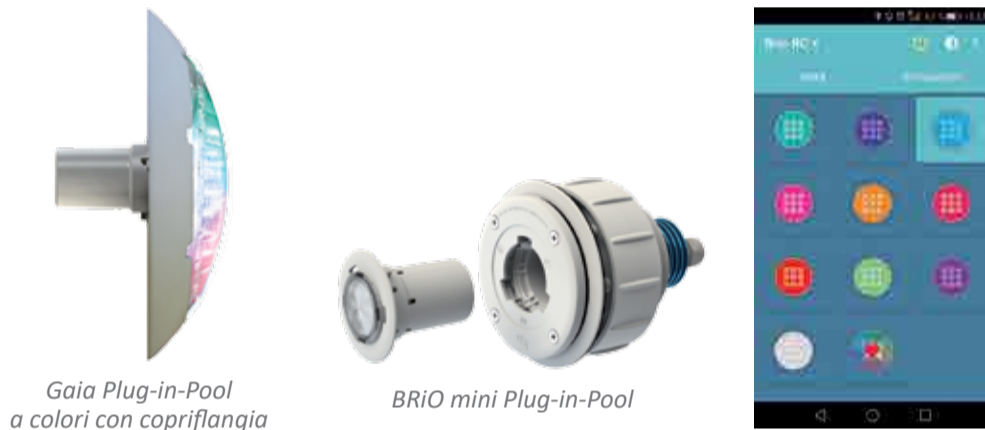
Gaia Plug-in-Pool a colori con copriflangia

Sul piano della sicurezza, il Plug-in-Pool vanta un'affidabilità del 100%. La corrente (24V CC) si attiva solo in presenza di presa compatibile nella base. Inoltre, in caso di attivazione, il sistema risulta privo di elementi conduttori. Costruito con materiali inerti alla corrosione per prevenire problemi di ossidazione, il sistema è di lunga durata.