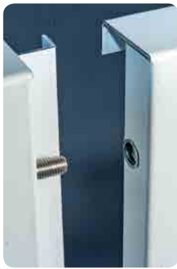
Struttura pannelli SuperHD