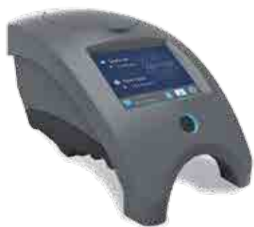
WaterLink Spin Touch Lab