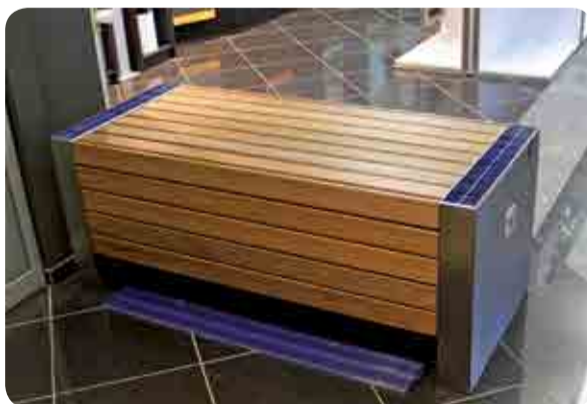
Exterior Cube Solar