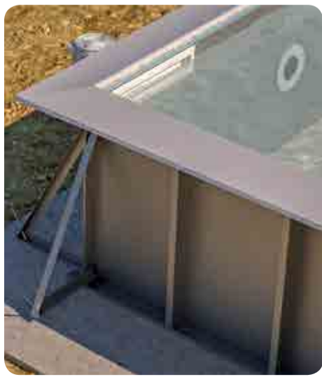
Struttura pannelli HD skimmer