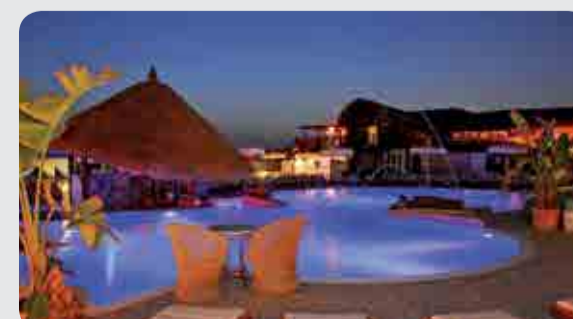
Piscina, Lido Rama beach - Varcaturò (NA), trattata con tecnologia Oxymatic totalmente ecologica.