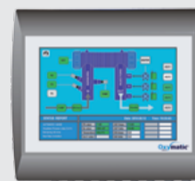
Unità di controllo Oxymatic Smart