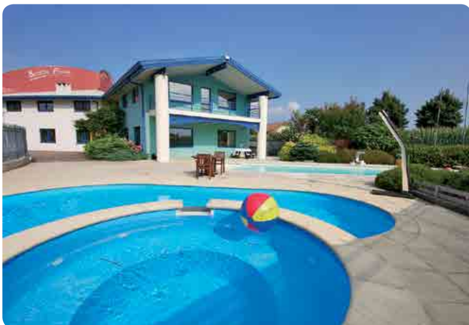
L'ufficio di SCP a Ivrea

Ogni funzionario commerciale collabora in azienda con la sua corrispondente addetta all'amministrazione delle vendite che si occupa di processare e gestire gli ordini di una determinata area. Questo è per noi importante per avere un team di riferimento sempre al servizio del cliente che conosce le dinamiche del distributore e quindi risponde puntualmente alle sue esigenze.