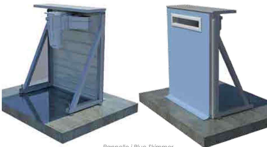
Pannello i.Blue Skimmer