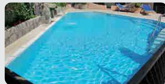
Hôtel Bellevue – Ischia Porto (NA) Prima piscina ipertermale cloruro – sodico – bicarbonato – solfata a 34-38 gradi trattata con l'innovativo sistema ecologico Oxymatic.