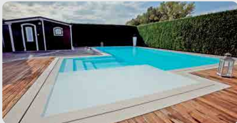
Piscina privata Bluestyle Sfiore Trilogy

la realizzazione delle vasche. Effettivamente i ridottissimi raggi di curvatura possibili, unitamente alla ridotta manutenzione ed alla possibilità di realizzare vasche di qualunque forma e dimensione, ci hanno consentito di essere presenti in parchi tra i più conosciuti a livello mondiale quali Wet