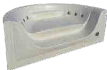
SCALE IN ACRILICO

domotico ENERGY CONTROL per controllo di flussi, temperatura, filtrazione e dosaggio dei prodotti completamente programmabile ed automatico. Presso lo stand D30-E29 - Padiglione 19, sarà esposta anche la mini piscina BLUE VISION adattabile alle necessità e alle personalizzazioni richieste dai clienti, il nuovo sistema elettrolitico e la rinnovata gamma "comfort pool" dei prodotti tecnici.