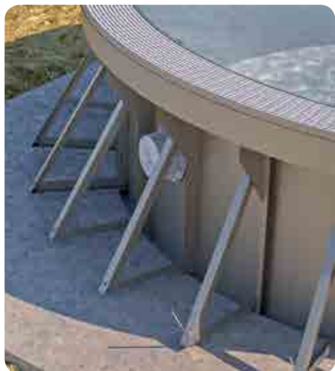
Struttura STEELFLEX bordo sfioratore