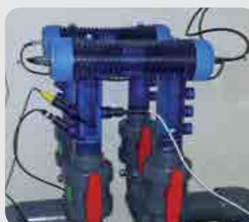
Camera porta celle e accessori Oxymatic