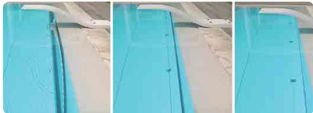
CHIUSURA AUTOMATICA del vano a fondo vasca

Da oggi, grazie all'innovativo sistema di chiusura automatica del vano, diventa anche sicura per i fruitori della vasca: la feritoia che permette alla tapparella di uscire dal vano sommerso si chiuderà in automatico al passaggio dell'ultima dogia, livellando completamente il piano calpestio ed eliminando il rischio di incastro.