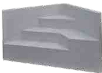
SCALE SOTTO LINER