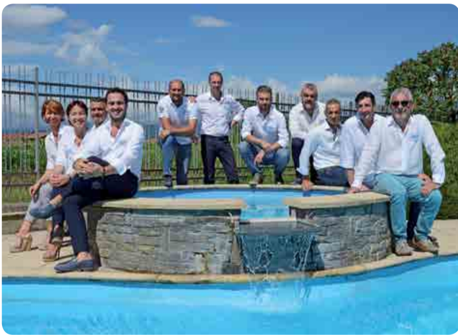
Il team di vendita