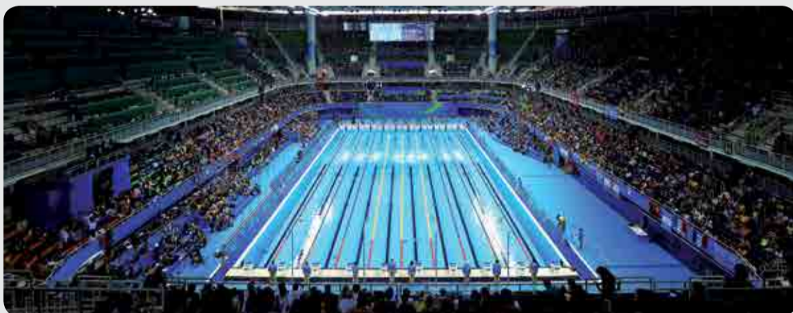
Myrtha Pools per Giochi Olimpici di Rio 2016

and Wild a Sydney e Galaxy a Macao. Parallelamente, nel mondo delle navi da crociera, si assiste sempre più all'inserimento di piccoli parchi acquatici sull'ultimo ponte delle navi stesse. E grazie alla collaborazione con compagnie quali MSC e Royal Caribbean, Myrtha Pools è presente anche in questo mondo.