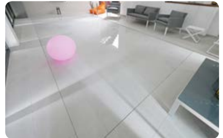
Realización "L'Esprit Piscine"