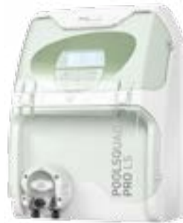
POOLSQUAD PRO LS

Además, con su amplia experiencia en el tratamiento salino para piscinas familiares, POOL TECHNOLOGIE ha desarrollado a lo largo de los años la gama « Profesional », perfectamente adecuada a piscinas colectivas privadas y públicas. Entre sus productos principales se destaca el electrolizador de sal, Professional Salt, diseñado para grandes volúmenes de agua, con una capacidad de producción de cloro de hasta 800 g/h. Además de la desinfección de agua, este dispositivo permite la destrucción parcial o total de las cloraminas, responsables